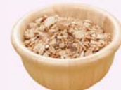
10 das Müsli