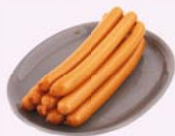
2 die Frankfurter Würstchen (Pl.)