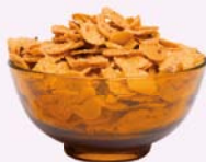
11 die Cornflakes (Pl.)