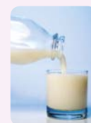
14 die Milch